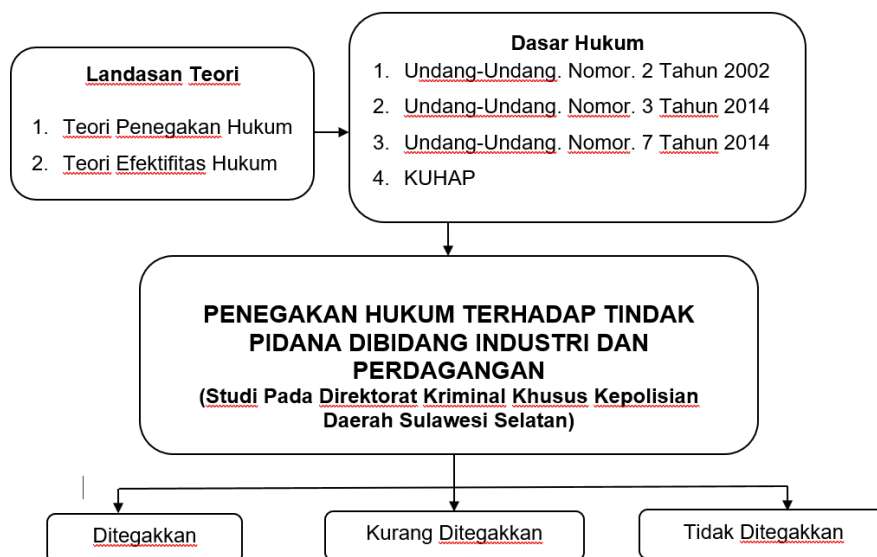
Gambar 1 Diagram Kerangka Konseptual

Tipe penelitian ini adalah penelitian hukum empiris, yaitu penelitian lapangan ( Field research ), dengan cara melakukan pengumpulan data di lapangan penelitian. Berdasarkan masalah yang diajukan dalam penelitian ini yang menekankan pada penegakan hukum terhadap tindak pidana di bidang industri dan perdagangan. Penelitian dilakukan pada Kantor Kepolisian Daerah Sulawesi Selatan. Berdasarkan penelitian ini yang dilaksanakan di Kantor Kepolisian Daerah Sulawesi Selatan. Maka populasi penelitian ini meliputi seluruh staf pada bagian Penyidik Kepolisian Daerah Sulawesi Selatan.